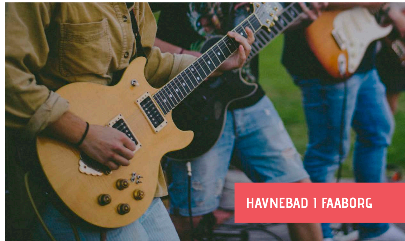
HAVNEBAD 1 FAABORG

Kulturregion Fyn har indgået en kulturaftale med Kulturministeriet, som løber fra 2015-slut 2018. Kulturaftalerne har blandt andet til formål at "fremme og videreudvikle de kulturelle institutioner, produktionsmiljøer og aktiviteter i kulturregionerne med vægt på kvalitet" og "opsamle og videregive særlig viden og erfaringer på kulturområdet til gavn for det samlede kulturliv i hele landet".