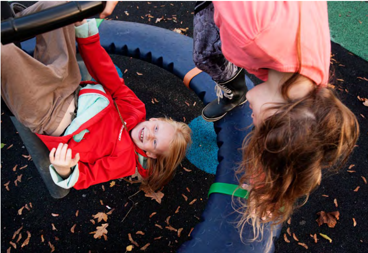
"Den-man-snurrer-rundt-på" på hovedet. ↑

Man kan have brug for hjælp fra sin far til "Den-man-snurrer-rundt-på". ↓