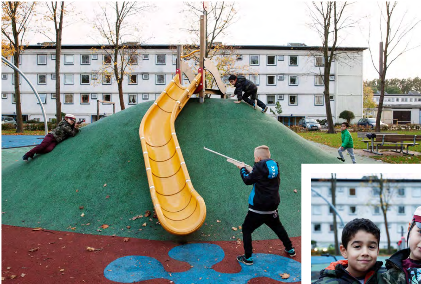
Drengene leger "krig". ↗

Legepladsen er bygget op omkring temaerne "Jorden brænder" og "Maveforfølelser". Temaerne stimulerer børnenes fantasi og skaber rammer for kreative lege. Drengene har opfundet "Lava-leg"(se video), og pigerne leger "krokodille" på bakken.