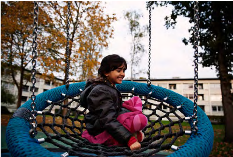
Aman gynger. ↗

De fleste børn synes klatrestativet, "Den store gyngende" og "Den-man-snurrer-rundt-på" er sjove. Der er både plads til at lege vildt og mere forsigtigt.